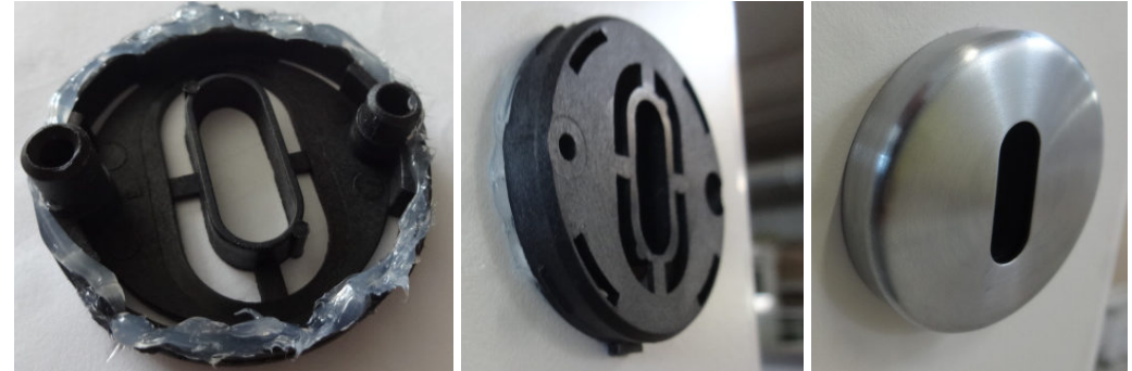
Bild 4: beispielhafte Veranschaulichung einer Sichtbeschlagsmontage