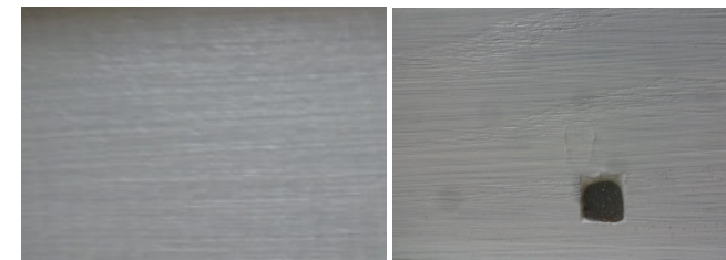
Bild 2: Beispiel lackiertes Bodenstück (links) Bohrungen verschlossen mit Silikon (rechts)