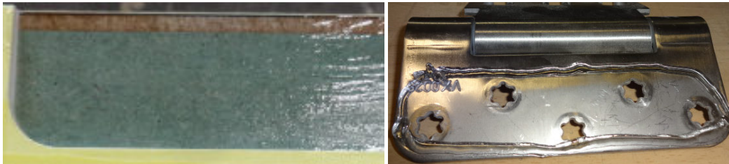
Bild 1: Versiegeln der Bandfräsungen am Türblatt im Falle einer Objektbandfräsung; Alternative: Abdichten mit Silikon