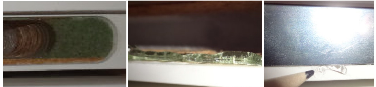
Bild 6: Abdichten der Schlosskastenfräsung gegenüber ablaufendem Spritzwasser (Silikonüberstände entfernen)