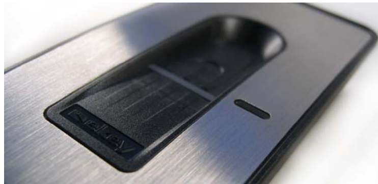
ekey integra, die Zutrittslösung für moderne Türen

Weitere Bilder unter www.ekey.net -> Downloads